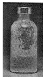
Fig. 3 - Não use este medicamento se partículas no fundo ou na parede derem ao frasco um aspecto fosco (embaçado).

Uso de seringa adequada: As doses de insulina são medidas em unidades . O número de unidades em cada mililitro (mL) está claramente impresso na embalagem. Cada tipo de insulina está disponível na concentração de 100 unidades/mL. É importante entender as graduações na seringa porque o volume a ser injetado depende da concentração, que é o número de unidades por mL. Por esta razão, deve-se utilizar sempre uma seringa graduada para a concentração de insulina. Erro no uso da seringa pode levar a um erro na dose, causando sérios problemas, como variação na glicemia (taxa de glicose no sangue) que pode ser muito baixa ou muito alta.