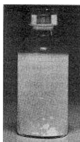
Fig. 2 - Não use este medicamento se houver grumos em suspensão (soltos) no líquido após a agitação.