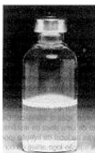
Fig. 1 - Não use este medicamento se o material permanecer no fundo do frasco após a agitação.

Os frascos de HUMULIN 70N/30R devem ser cuidadosamente agitados com movimentos rotativos antes de cada aplicação, de maneira que o conteúdo seja uniformemente misturado. Após agitar suavemente, o conteúdo deve estar turvo ou leitoso. Não usar se, após a agitação, a insulina (material branco) permanecer no fundo do frasco (Fig. 1), se houver grumos (pequenos grãos) suspensos no líquido (Fig. 2), ou se partículas no fundo ou na parede derem ao frasco um aspecto fosco/embaçado (Fig. 3).