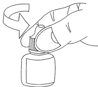
Figura 1: Coloque o frasco na posição vertical com a tampa para o lado de cima, gire-a até romper o lacre.

A administração da solução oral deve ser feita 10 minutos antes das refeições.